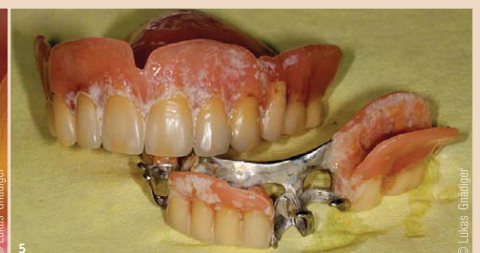
Abb. 3: Beläge und Gingivitis. – Abb. 4: Ungenügende Mundhygiene. – Abb. 5: Schmutzige Prothese.