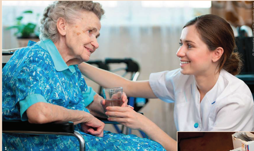
Abb. 1: Seniorin in einer Pflegeeinrichtung. – Abb. 2: Polymedikation im Alter.

Das Betreuungskonzept verfolgt drei Stossrichtungen: Schulung des Personals von Institutionen und Spitex-Organisationen mit praktischen Übungen direkt an den Betagten, eine Triagierung jedes zu betreuenden Senioren durch den leitenden Zahnarzt und Pflegeleistungen durch PAss. Prinzipiell gilt: Wer mobil ist, soll möglichst lange von seinem Zahnarzt der Wahl in dessen Praxis weiterbetreut werden. Das Team aus Zahnarzt, Dentalhygienikerin und PAss bietet hier dank optimaler Infrastruktur die beste Betreuung in vertrautem Umfeld. Die Patienten sollen bewusst angehalten