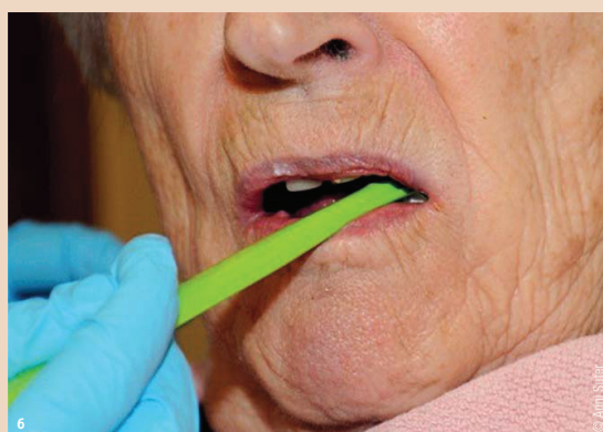
Abb. 6: Mundpflege bei Pflegebedürftigen.

Bei Gingivitis oder Mukositis führen kleinste Berührungen der Mundschleimhaut zu einer Bakteriämie grösseren Ausmasses. Hochrisikopatienten laufen Gefahr, eine Endokarditis zu erleiden. Parodontitiden schreiten bei vernachlässigter Mundpflege voran. Die For-