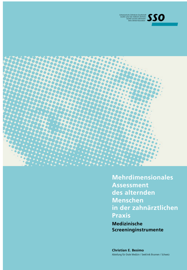
Abb. 1 Manual zum mehrdimensionalen Patientenscreening in der zahnärztlichen Praxis

Die Organisation dieses strukturierten, systematischen Gesundheitsscreenings alternder Menschen in der zahnärztlichen Praxis ist einfach möglich. Die Praxisstrukturen und Arbeits-